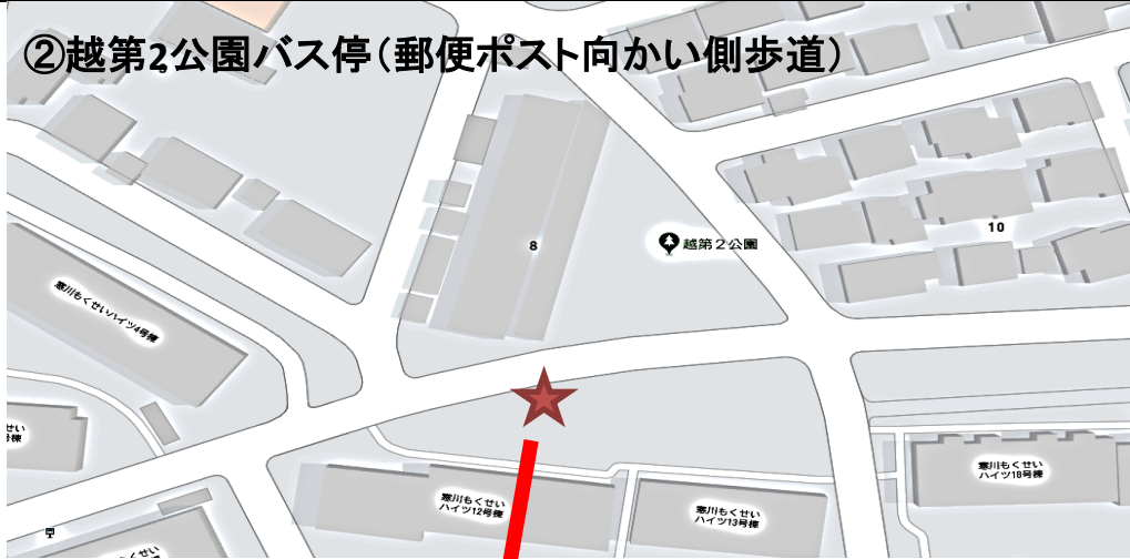
②越第2公園バス停(郵便ポスト向かい側歩道)